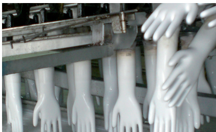
1. Die Handschuhe werden mit Hilfe von Keramikformen hergestellt.