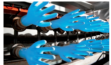
3. Die Handschuhe werden mit Chlor gewaschen, um eventuelle Rückstände der Produktion von den Handschuhen zu entfernen.