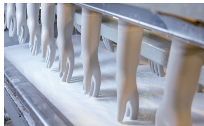
2. Die Formen werden in die flüssige Latex- bzw. Nitrilmasse eingetaucht. Dieser Schritt wird einige Male mit Trocknungsphasen wiederholt.