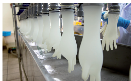
5. Danach werden die Handschuhe verschiedenen Qualitätsprüfungen unterzogen.