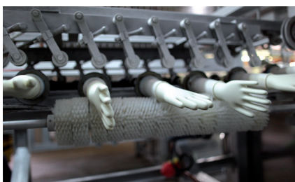
4. Zum Schluss werden die Handschuhe von den Formen gelöst, der „typische“ Rollrand entsteht.